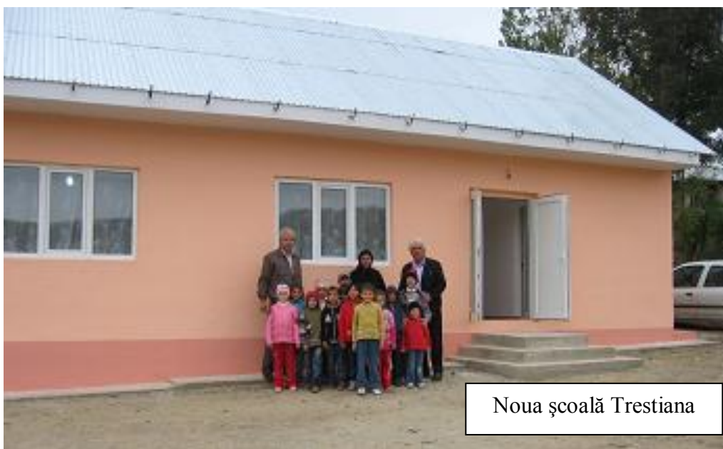
Noua școală Trestiana

Publicația comunei Răducăneni, Anul II, numărul 12, ianuarie-februarie 2010