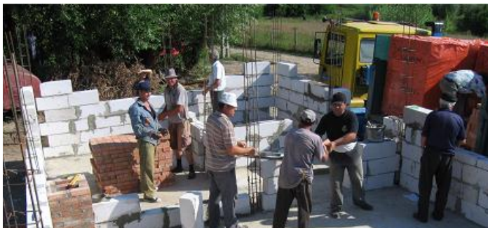
Construire școală la Trestiana – Răducăneni, 2009

Am identificat un număr de 40 de puncte de colectare selectivă a deșeurilor menajere, în toată comuna, fiind vizate zonele mai aglomerate ca : școli, piață, blocuri, etc. În aceste puncte au fost realizate platforme betonate de cca 10-12 mp, îngrădite și acoperite, urmând ca pe acestea să fie amplasate câte 3 euro-pubele.